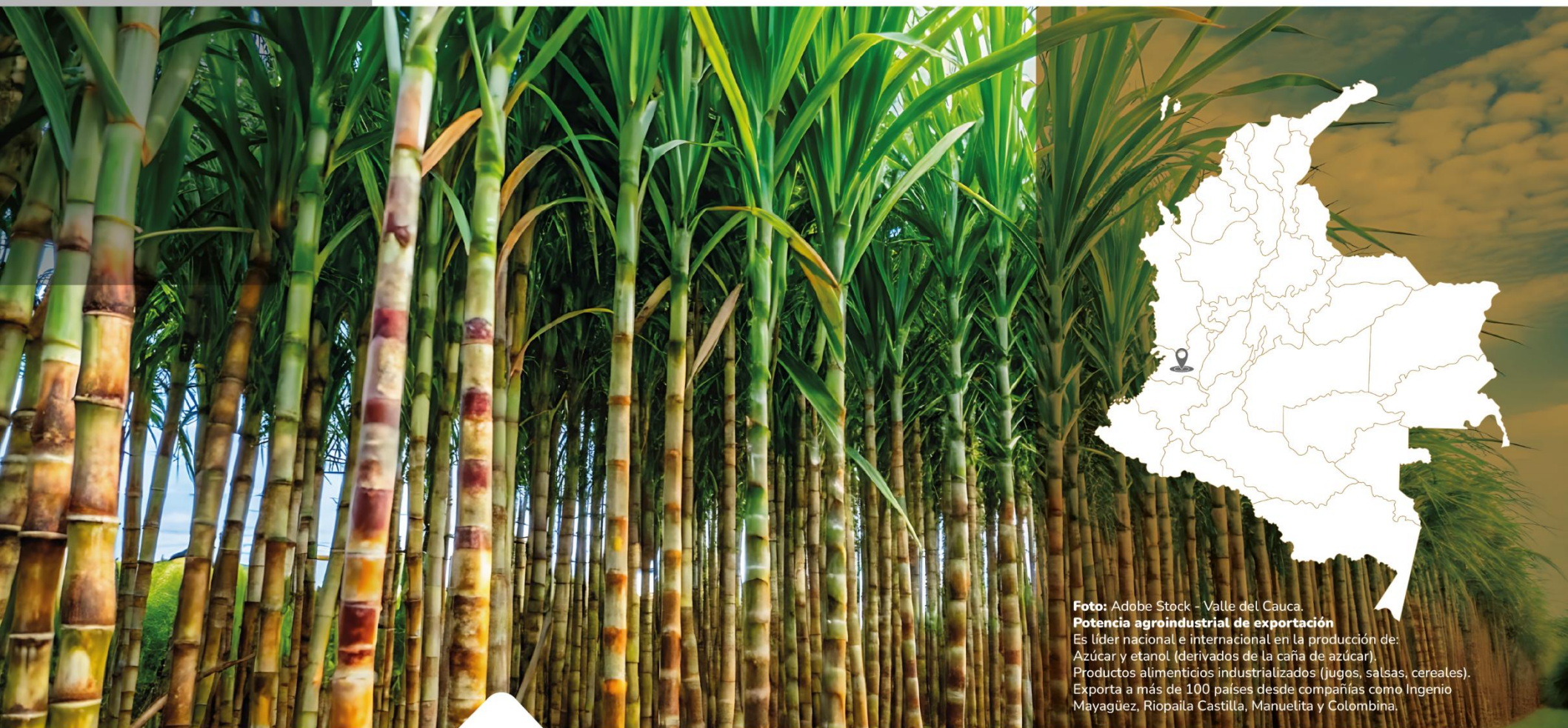
Valle del Cauca.