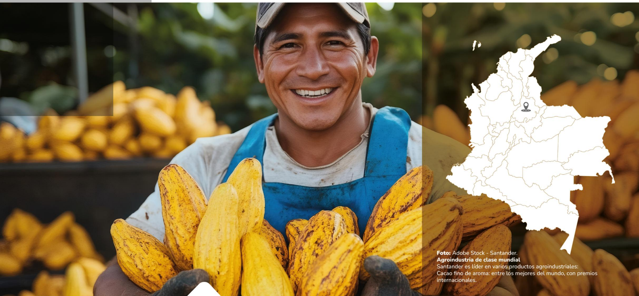
Santander. Agroindustria de clase mundial Santander es líder en varios productos agroindustriales: Cacao fino de aroma: entre los mejores del mundo, con premios internacionales.