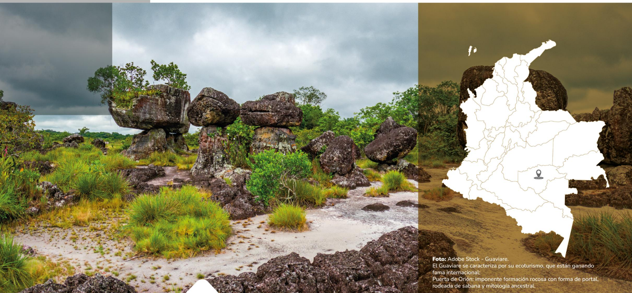
Guaviare. El Guaviare se caracteriza por su ecoturismo, que están ganando fama internacional. Puerta de Orión: imponente formación rocosa con forma de portal, rodeada de sabana y mitología ancestral.