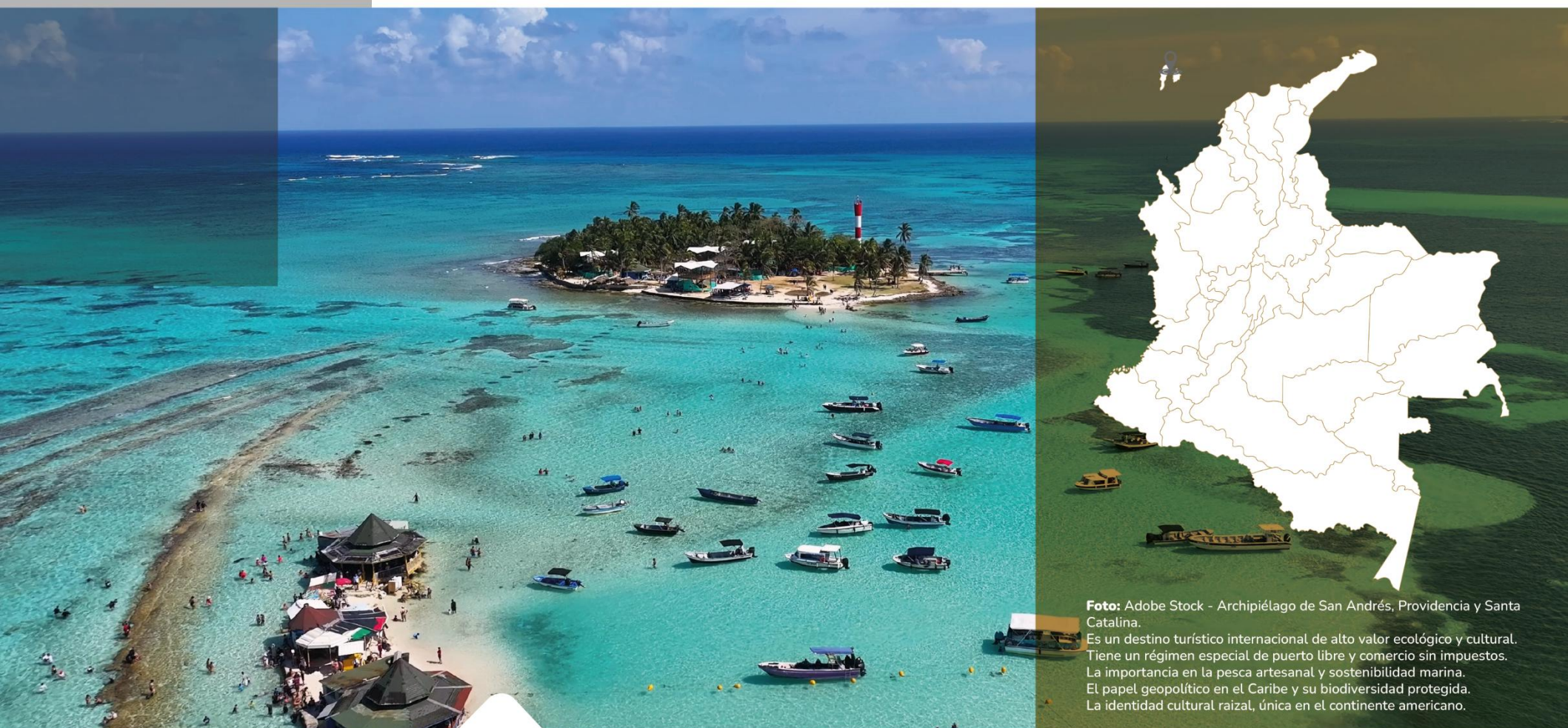
Archipiélago de San Andrés, Providencia y Santa Catalina. Es un destino turístico internacional de alto valor ecológico y cultural. Tiene un régimen especial de puerto libre y comercio sin impuestos. La importancia en la pesca artesanal y sostenibilidad marina. El papel geopolítico en el Caribe y su biodiversidad protegida. La identidad cultural raizal, única en el continente americano.