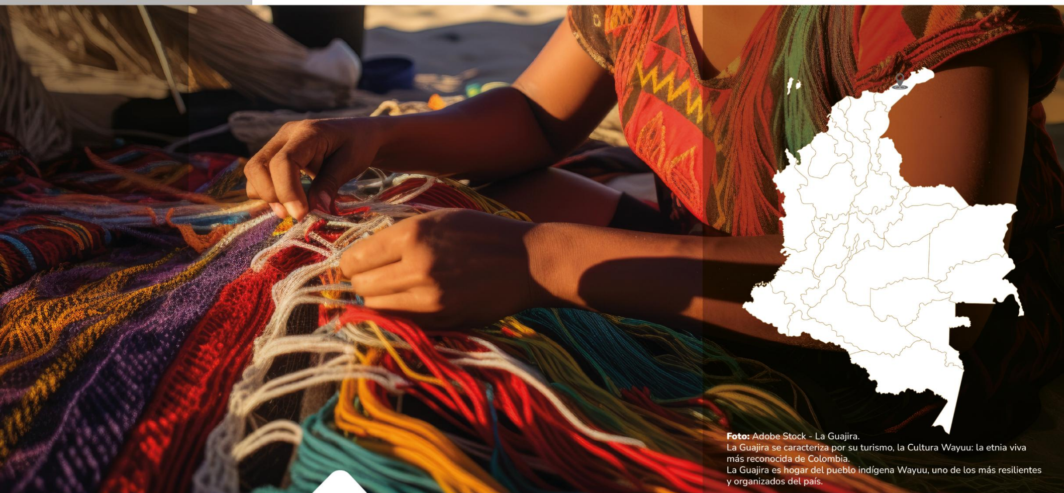
La Guajira. La Guajira se caracteriza por su turismo, la Cultura Wayuu: la etnia viva más reconocida de Colombia. La Guajira es hogar del pueblo indígena Wayuu, uno de los más resilientes y organizados del país.