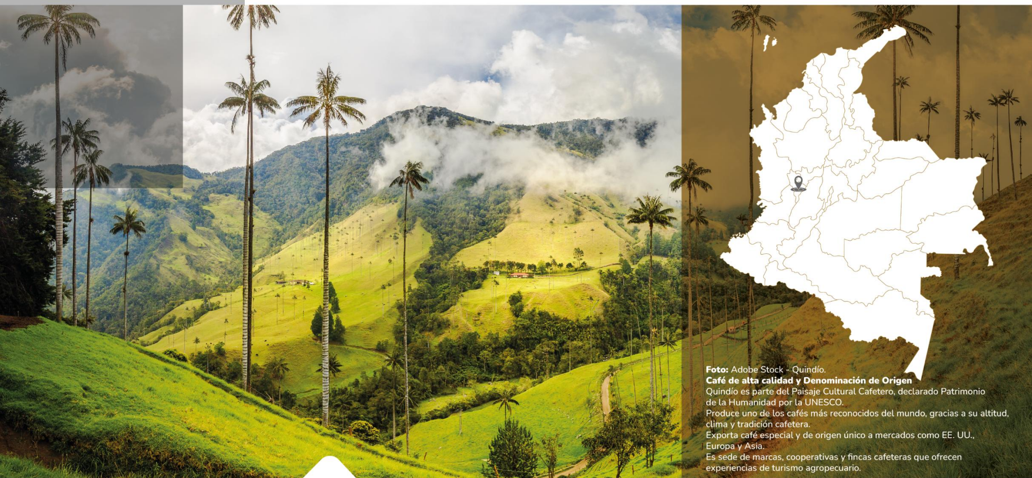
Quindío. Café de alta calidad y Denominación de Origen Quindío es parte del Paisaje Cultural Cafetero, declarado Patrimonio de la Humanidad por la UNESCO. Produce uno de los cafés más reconocidos del mundo, gracias a su altitud, clima y tradición cafetera. Exporta café especial y de origen único a mercados como EE. UU., Europa y Asia. Es sede de marcas, cooperativas y fincas cafeteras que ofrecen experiencias de turismo agropecuario.