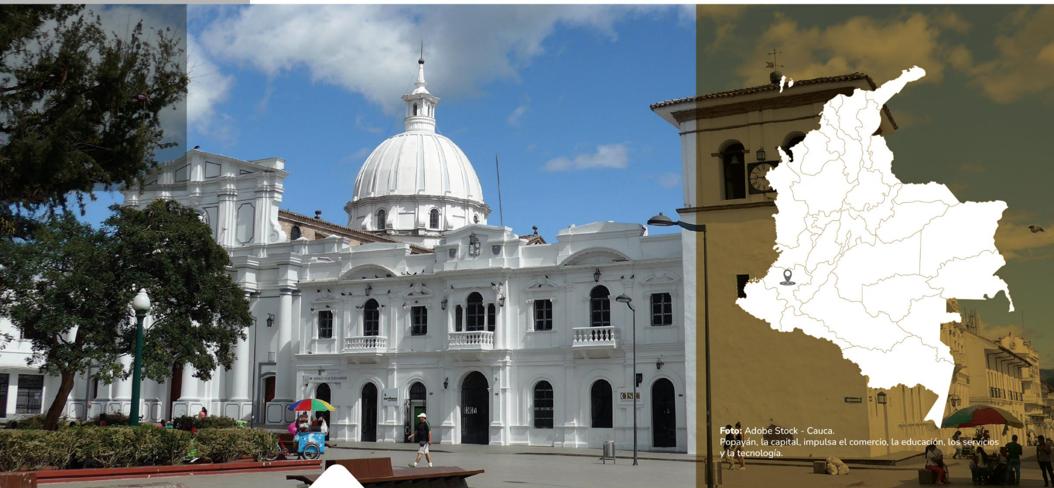
Cauca. Popayán, la capital, impulsa el comercio, la educación, los servicios y la tecnología.