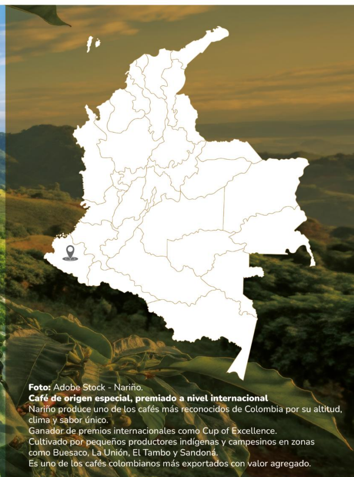
Nariño. Café de origen especial, premiado a nivel internacional Nariño produce uno de los cafés más reconocidos de Colombia por su altitud, clima y sabor único. Ganador de premios internacionales como Cup of Excellence. Cultivado por pequeños productores indígenas y campesinos en zonas como Buesaco, La Unión, El Tambo y Sandoná. Es uno de los cafés colombianos más exportados con valor agregado.