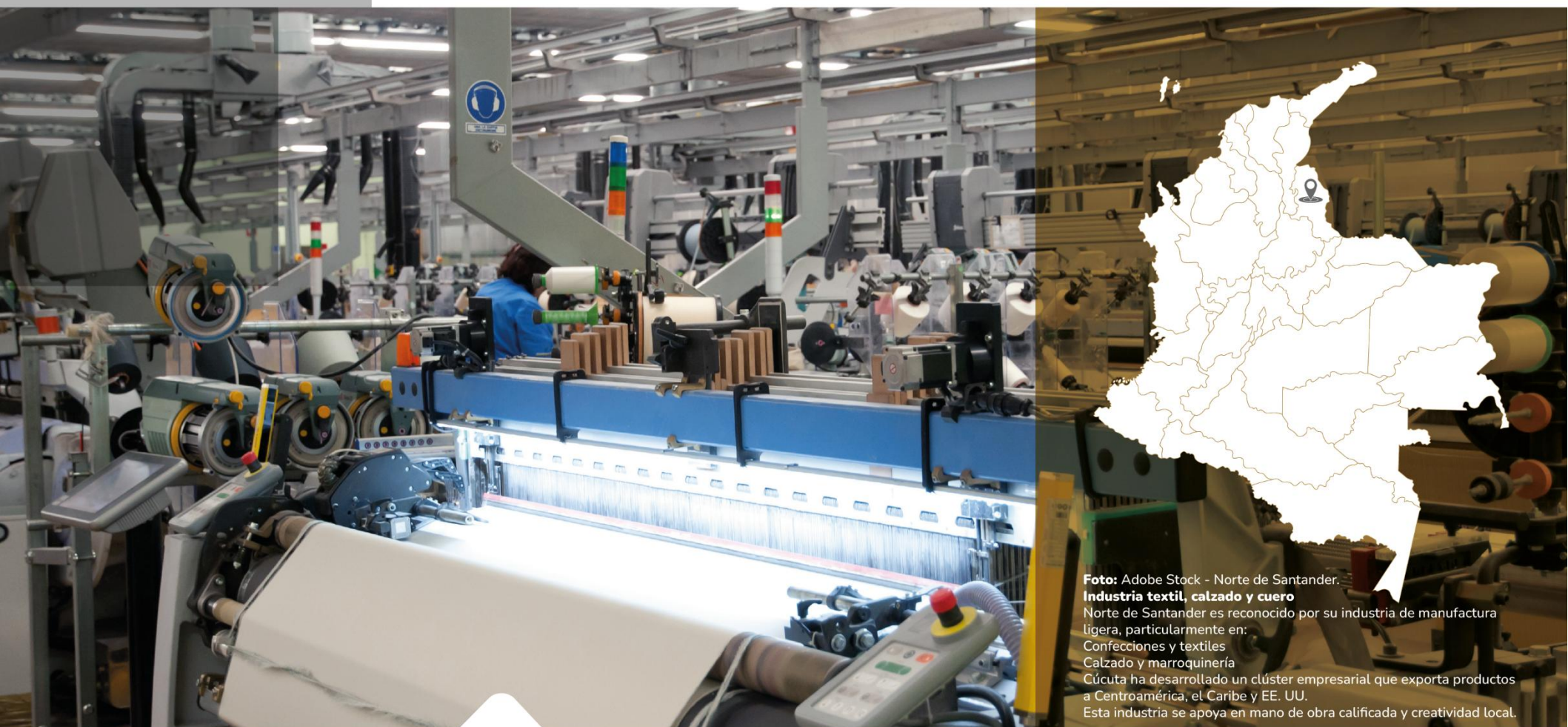
Norte de Santander. Industria textil, calzado y cuero Norte de Santander es reconocido por su industria de manufactura ligera, particularmente en: Confecciones y textiles Calzado y marroquinería Cúcuta ha desarrollado un clúster empresarial que exporta productos a Centroamérica, el Caribe y EE. UU. Esta industria se apoya en mano de obra calificada y creatividad local.