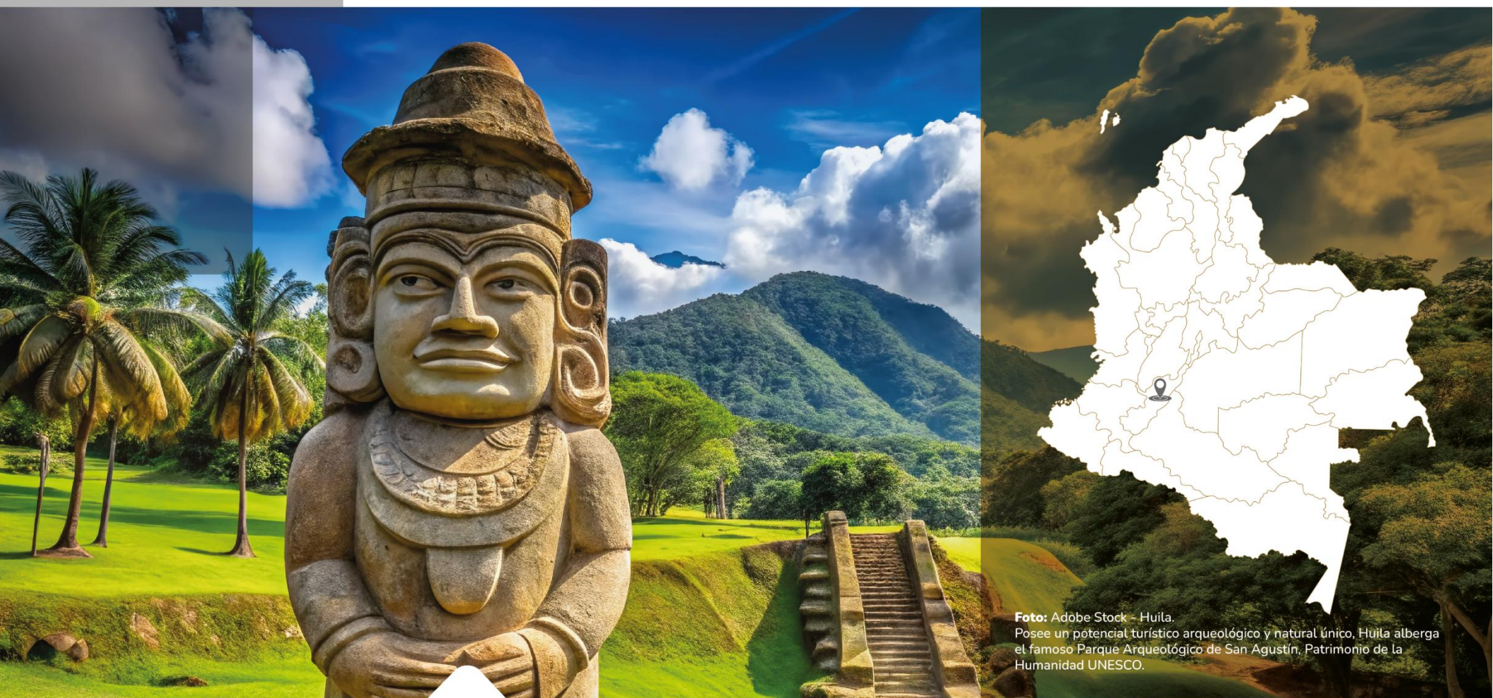
Huila. Posee un potencial turístico arqueológico y natural único, Huila alberga el famoso Parque Arqueológico de San Agustín, Patrimonio de la Humanidad UNESCO.