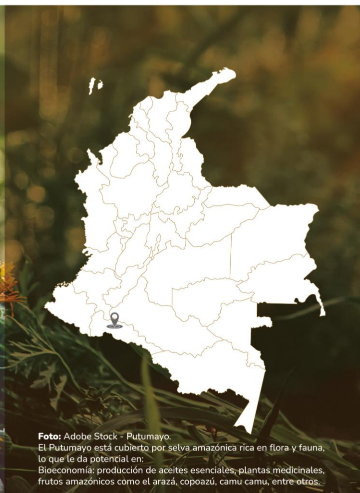
Putumayo. El Putumayo está cubierto por selva amazónica rica en flora y fauna, lo que le da potencial en: Bioeconomía: producción de aceites esenciales, plantas medicinales, frutos amazónicos como el arazá, copoazú, camu camu, entre otros.