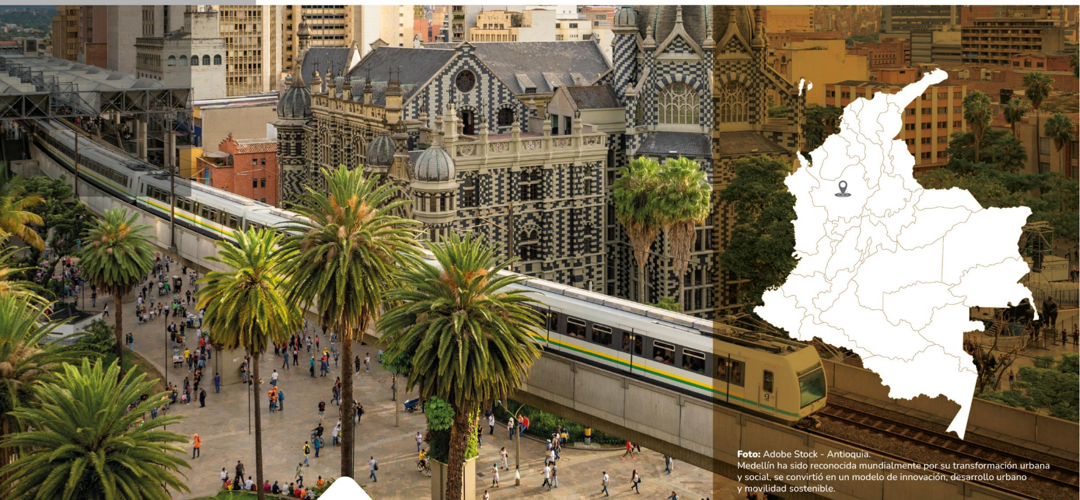
Antioquia. Medellín ha sido reconocida mundialmente por su transformación urbana y social, se convirtió en un modelo de innovación, desarrollo urbano y movilidad sostenible.