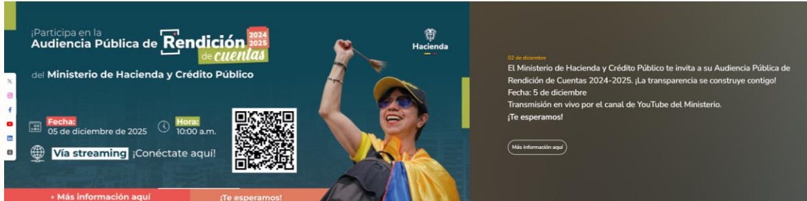
Figura 1. Invitación y participación rendición de cuentas