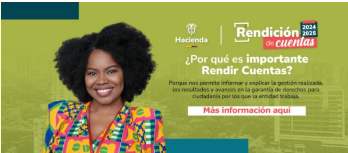
Figura 3. Te contamos: ¿Qué es una Rendición de Cuentas?