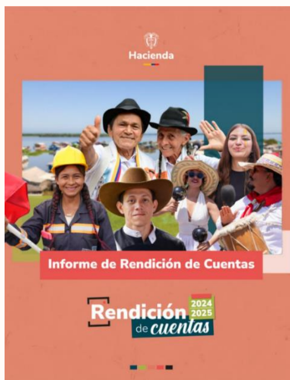
Figura 5. Informe de Rendición de Cuentas 2024-2025 2