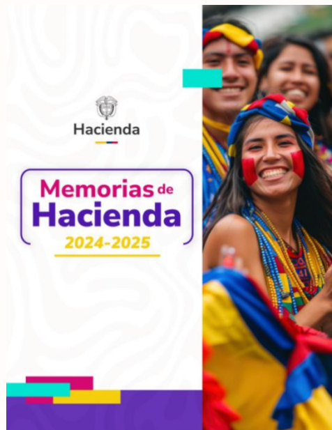
Figura 6. Informe de memorias Hacienda 2024 - 2025 3