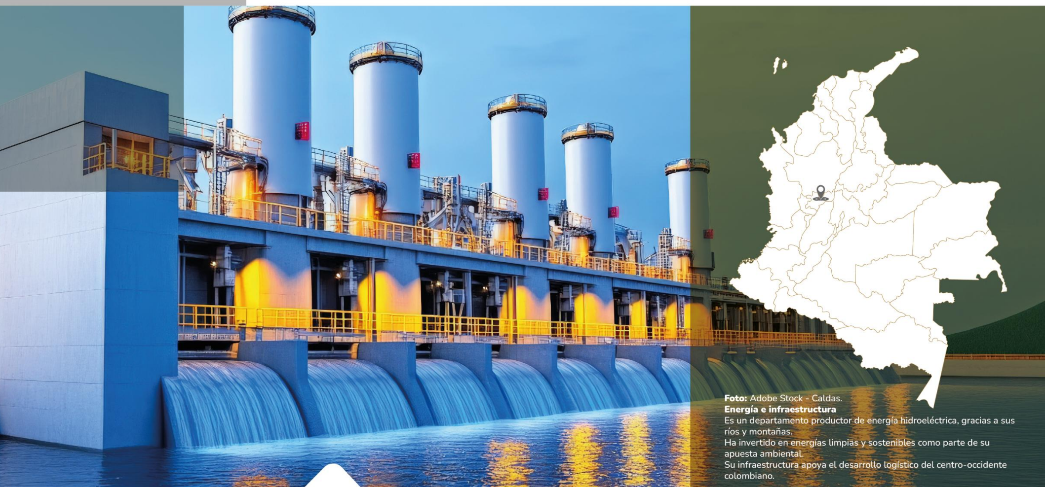
Caldas. Energía e infraestructura Es un departamento productor de energía hidroeléctrica, gracias a sus ríos y montañas. Ha invertido en energías limpias y sostenibles como parte de su apuesta ambiental. Su infraestructura apoya el desarrollo logístico del centro-occidente colombiano.