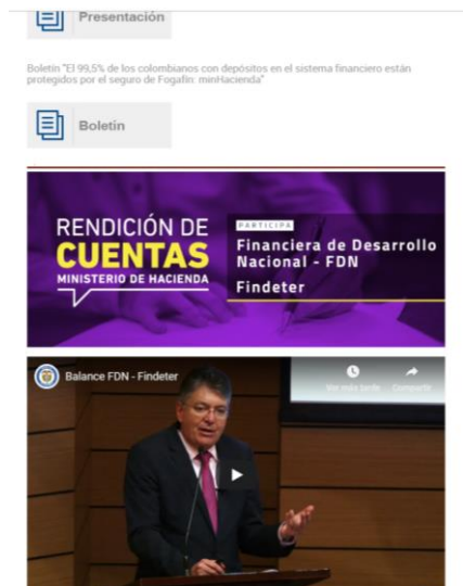
Boletín "Colombia tiene una banca de desarrollo con los mejores estándares del mundo" minhacienda"