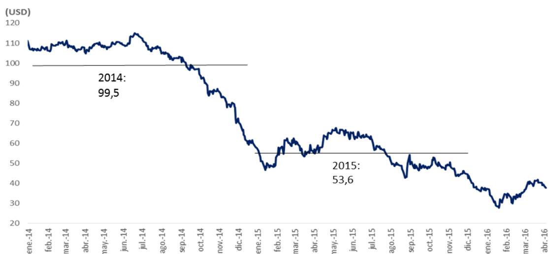
Gráfico 2 Precio Spot Diario del Petróleo Brent 2014 – 2016

Como resultado del comportamiento de los precios del crudo de la canasta colombiana durante el 2015, se observó un diferencial de US$30,2 por barril entre el precio de largo plazo establecido en el Marco Fiscal de Mediano Plazo 2015 (MFMP 2015), US$73,6 por barril, y el precio promedio observado para ese año, US$43,4 por barril. El diferencial observado al cierre de la vigencia 2015 fue US$4,6 mayor al proyectado en el MFMP 2015 lo que trajo consigo un mayor ciclo energético que el pronosticado en dicho documento.