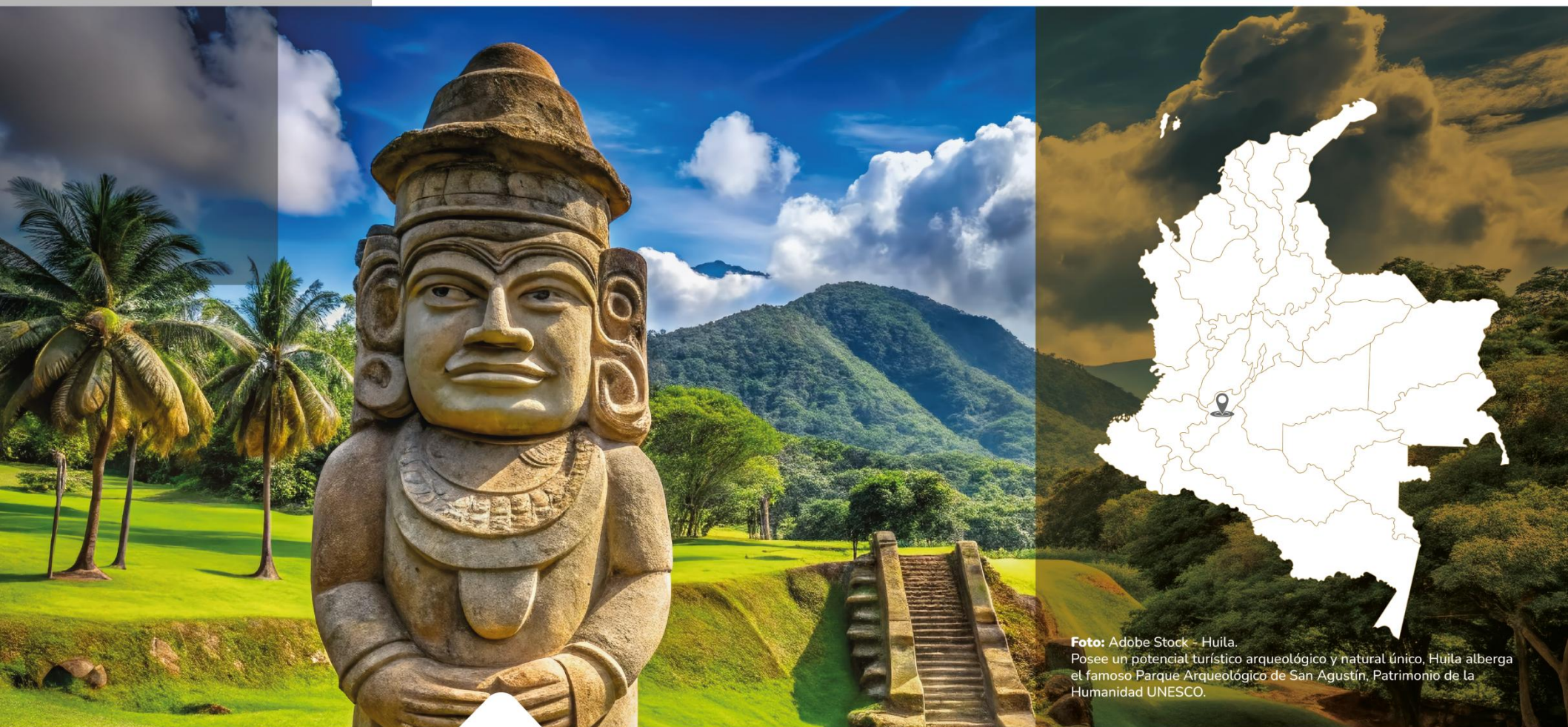
Huila. Posee un potencial turístico arqueológico y natural único, Huila alberga el famoso Parque Arqueológico de San Agustín, Patrimonio de la Humanidad UNESCO.