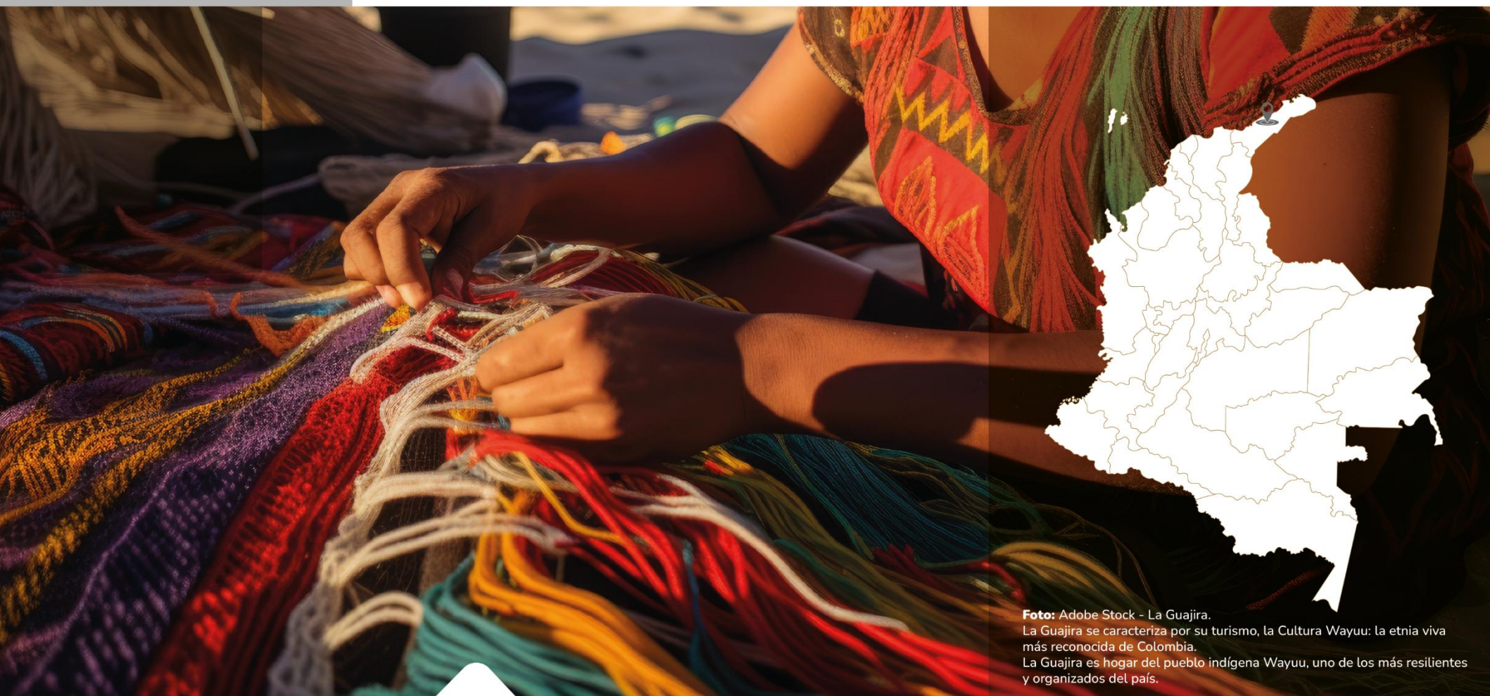
La Guajira. La Guajira se caracteriza por su turismo, la Cultura Wayuu: la etnia viva más reconocida de Colombia. La Guajira es hogar del pueblo indígena Wayuu, uno de los más resilientes y organizados del país.