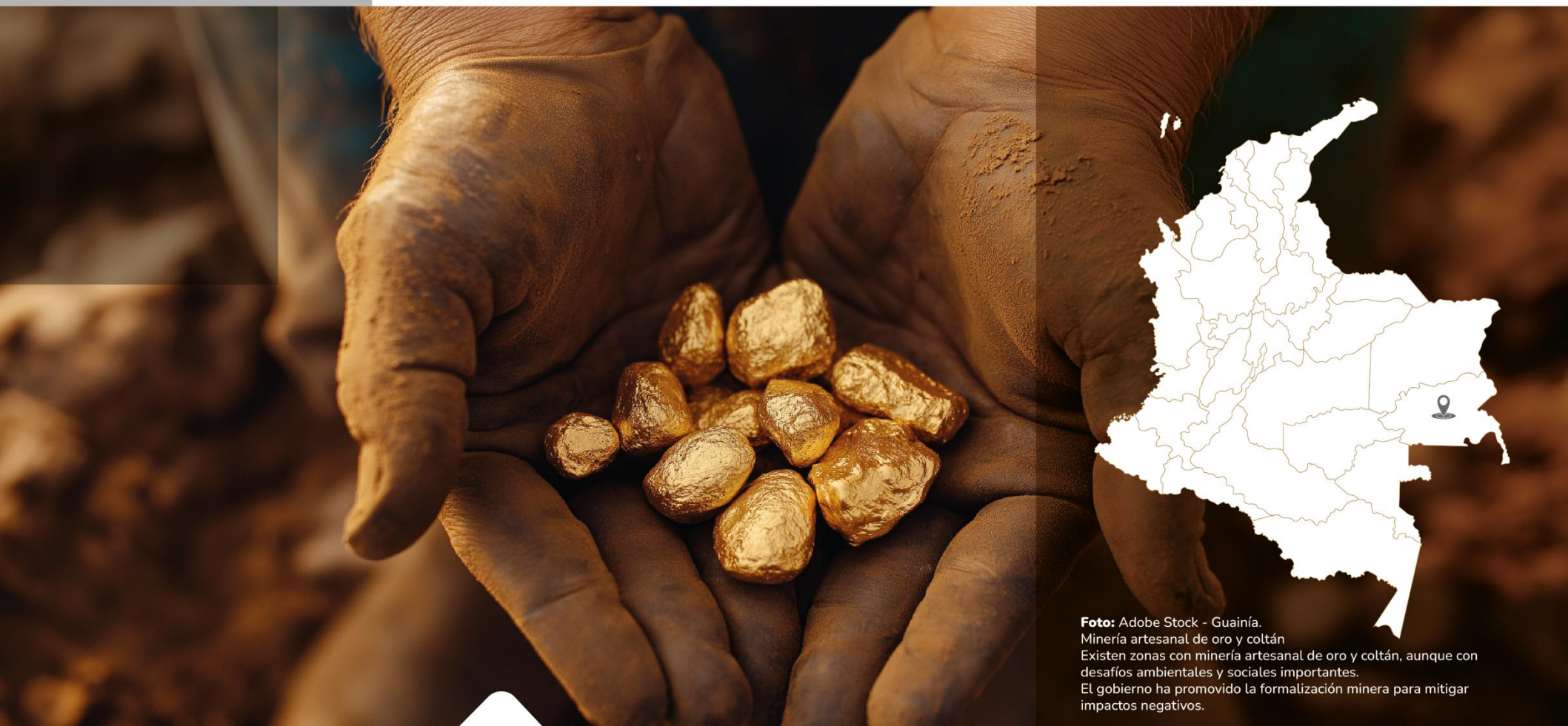
Guainía. Minería artesanal de oro y coltán Existen zonas con minería artesanal de oro y coltán, aunque con desafíos ambientales y sociales importantes. El gobierno ha promovido la formalización minera para mitigar impactos negativos.