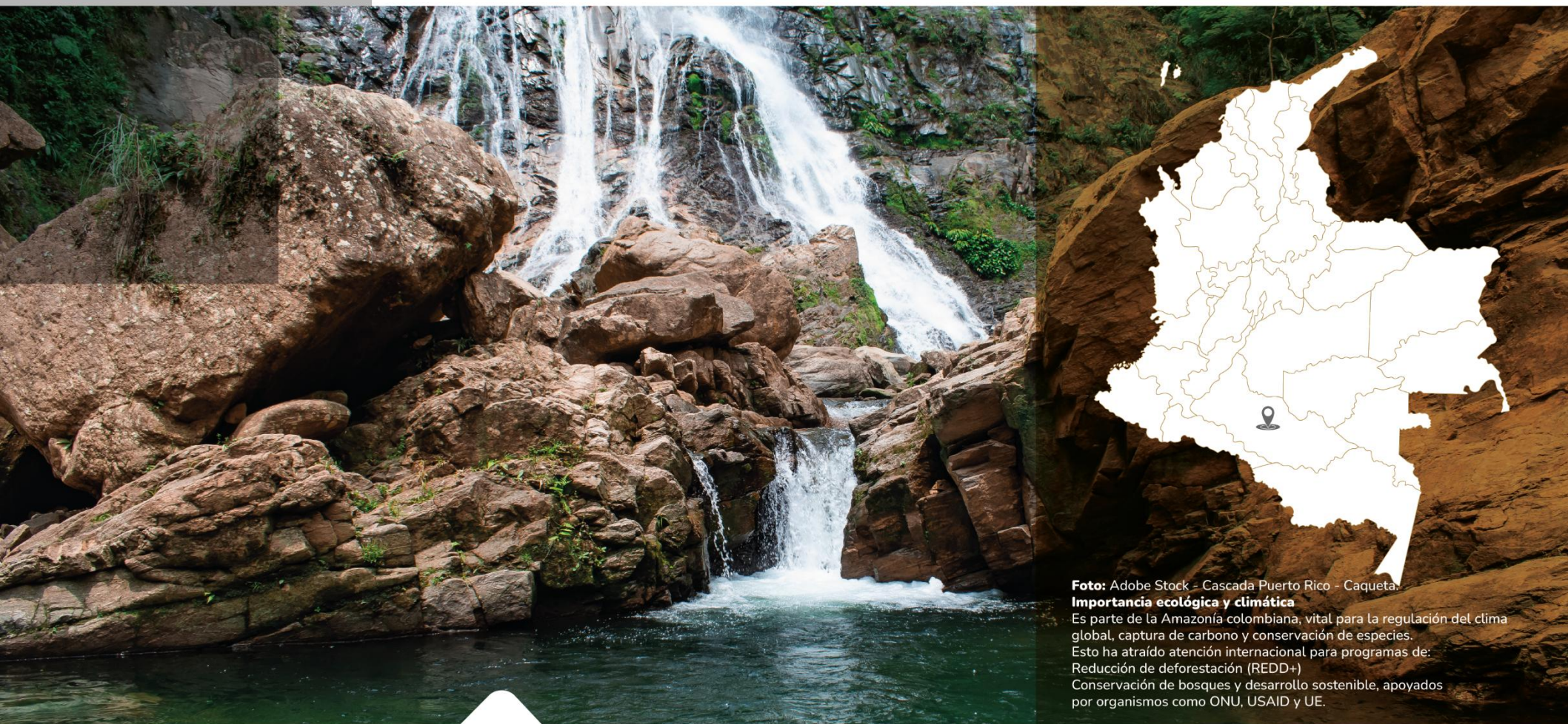
Cascada Puerto Rico - Caqueta.