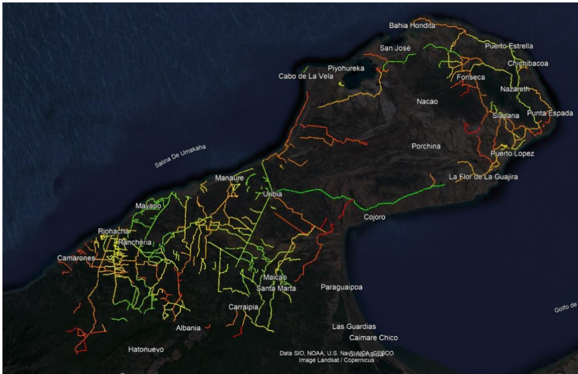
Ilustración 2. Calificación preliminar red vial