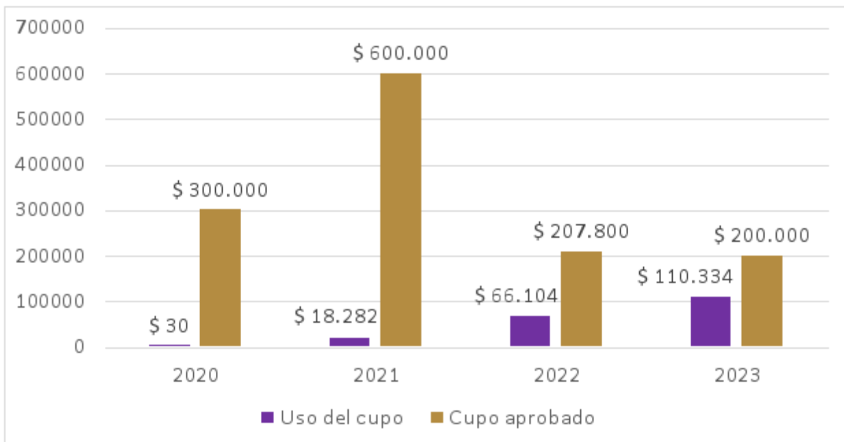
Gráfico 1. Comportamiento de las inversiones y donaciones para proyectos de las culturas, las artes y el patrimonio (2020-2023).

Fuente: Cocrea y Ministerio de las Culturas, las Artes y los Saberes. Dirección de Estrategia, Desarrollo y Emprendimiento. * Cifras en millones de pesos. Corte a 29 de febrero de 2023.