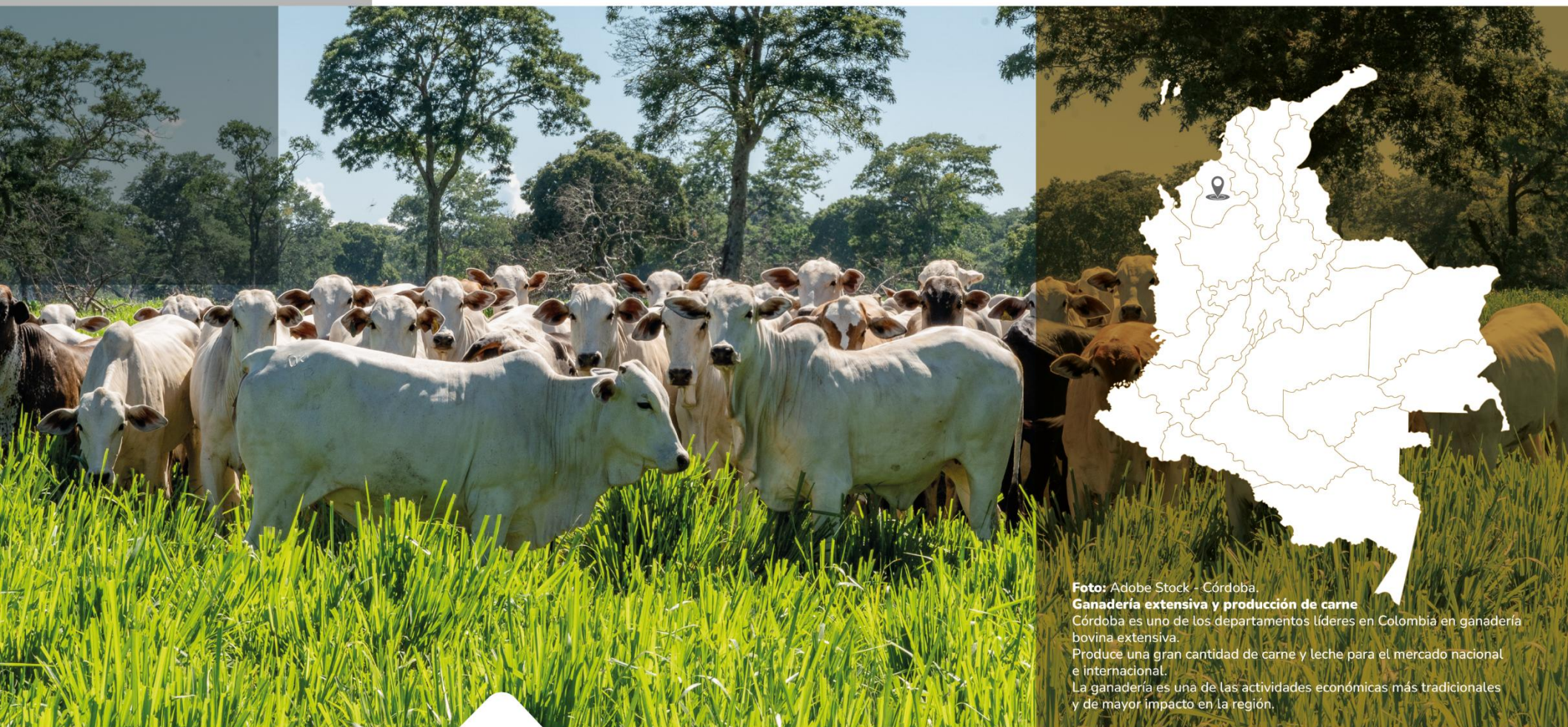
Córdoba. Ganadería extensiva y producción de carne Córdoba es uno de los departamentos líderes en Colombia en ganadería bovina extensiva. Produce una gran cantidad de carne y leche para el mercado nacional e internacional. La ganadería es una de las actividades económicas más tradicionales y de mayor impacto en la región.