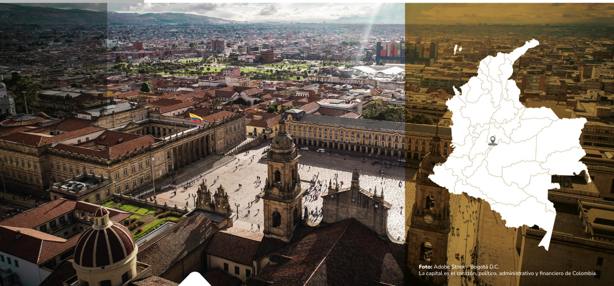
Bogotá D.C. La capital es el corazón, político, administrativo y financiero de Colombia.