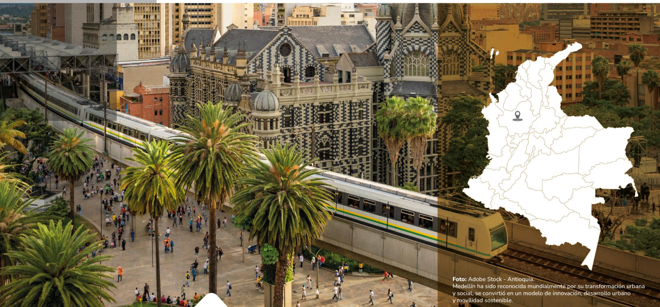
Antioquia. Medellín ha sido reconocida mundialmente por su transformación urbana y social, se convirtió en un modelo de innovación, desarrollo urbano y movilidad sostenible.