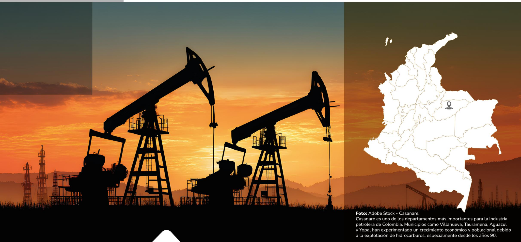
Casanare. Casanare es uno de los departamentos más importantes para la industria petrolera de Colombia. Municipios como Villanueva, Tauramena, Aguazul y Yopal han experimentado un crecimiento económico y poblacional debido a la explotación de hidrocarburos, especialmente desde los años 90.