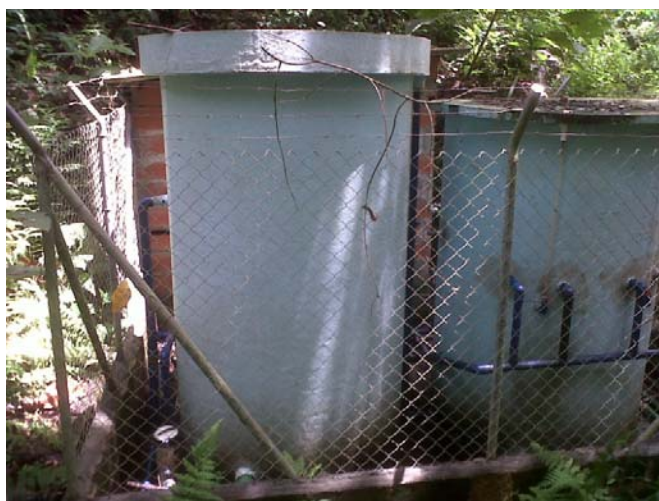
Acueducto Vereda la Lomita

Al término de la auditoría, se observó el funcionamiento del acueducto Veredal de La Lomita, sin embargo carecía de mantenimiento, evidenciado a través del taponamiento parcial en la captación. Se requiere que teniendo en cuenta la inversión efectuada por el Municipio, se haga una periódica visita de mantenimiento, para garantizar la continuidad en la prestación del servicio.