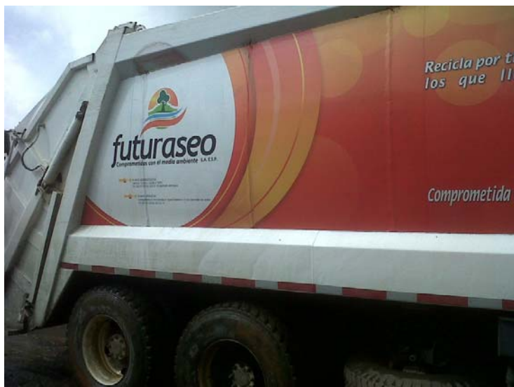
Prestación del servicio de aseo en Belén de Bajirá

Presta su servicio en el área urbana del Municipio de Mutata y en la vereda de Belén de Bajirá. Para diciembre de 2012, de acuerdo con información reportada al Sistema Único de Información, cuenta con 3.992 suscriptores.