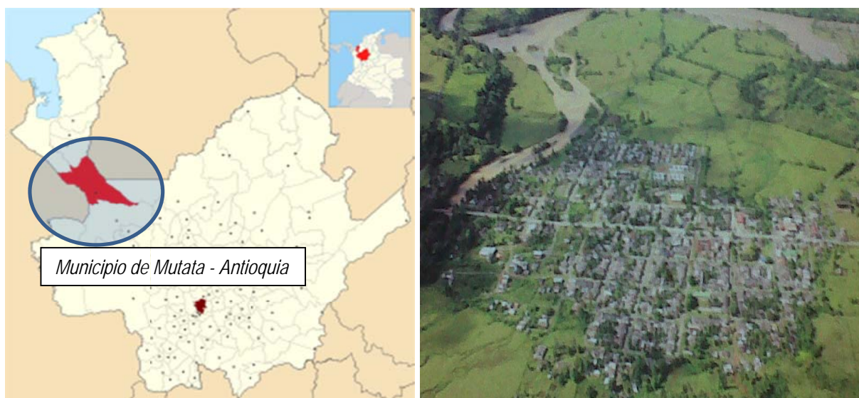
Municipio de Mutata

La actividad pecuaria se caracteriza por ser de tipo extensivo y tradicional. La actividad ganadera ha ocasionado desplazamientos de pequeños productores hacia las laderas, los cuales se insertan a las labores de economía campesina ya establecidos o en algunos casos se ven obligados a ampliar la frontera agrícola con prácticas inadecuadas. Adicional a esto la explotación de la minería aurífera de manera artesanal ha atraído diferentes actores que influyen sobre la economía del Municipio.