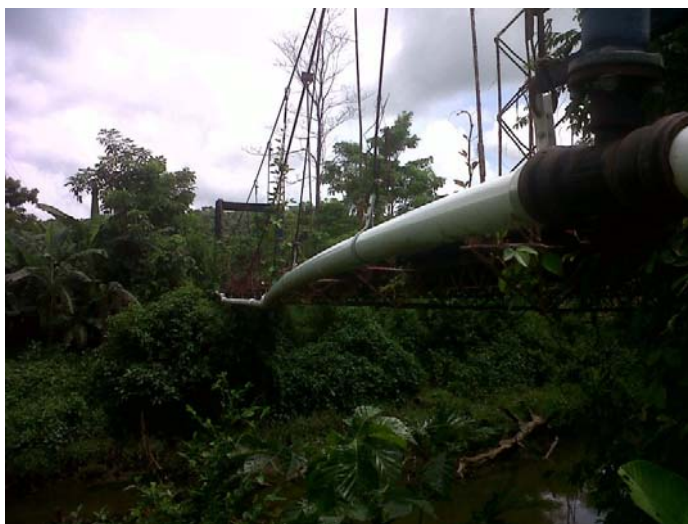
Línea de conducción del acueducto de Lomitas

En relación a la ejecución de los recursos del contrato, en el informe de interventoría al revisar el punto 2.5.1 balance del contrato, el valor del acta número 4 está por $242.783.109, en el punto 2.5.2 Balance de Anticipo, la amortización efectuada por el acta 4 fue por $116.892.517, existiendo una diferencia por amortizar de $125.890.592, cifras que no se explican en el informe. Tampoco se amortiza el valor del acta número 5. De esta manera el saldo pendiente de pago estaría por $341.258.410, correspondientes al saldo de pago del acta número 4, acta número 5 y el saldo pendiente.