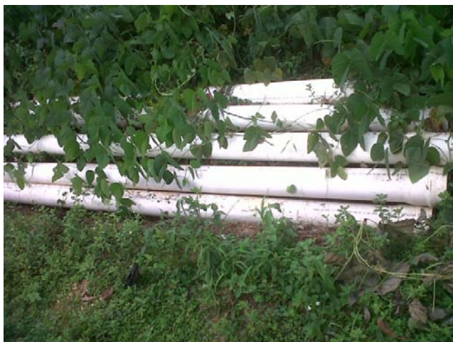
Tubería y tanque de almacenamiento Del acueducto inconcluso de Pavarandó.

El avance físico de la obra está dado de la siguiente manera: