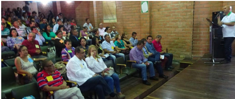
Foto: Motivación del alcalde a la comunidad antes de iniciar con la estructura de ingresos, gastos y el S.G.P. Municipio de Bello – Antioquia, Mayo 8/15.

Se parte de la explicación de cómo está estructurado el presupuesto del municipio, aludiendo en particular a los ingresos tributarios y no tributarios más importantes de la entidad territorial y los ingresos de capital, como también a la estructura de gastos. Luego se pasa al Sistema General de Participaciones. Se propició una permanente retroalimentación entre los participantes y los facilitadores del taller.