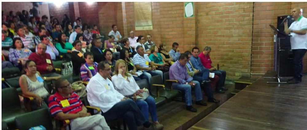
Foto: Motivación del alcalde a la comunidad antes de iniciar con la estructura de ingresos, gastos y el S.G.P. Municipio de Bello – Antioquia, Mayo 8/15.

Se parte de la explicación de cómo está estructurado el presupuesto del municipio, aludiendo en particular a los ingresos tributarios y no tributarios más importantes de la entidad territorial y los ingresos de capital, como también a la estructura de gastos. Luego se pasa al Sistema General de Participaciones. Se propició una permanente retroalimentación entre los participantes y los facilitadores del taller.