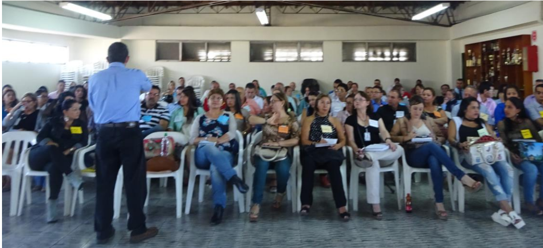
Foto: Explicación ingresos, gastos y el S.G.P. Equipo de gobierno Municipio de Bello – Antioquia, Mayo 7/15.