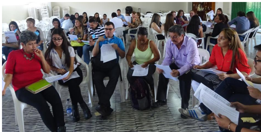
Fotos: Equipo de gobierno, comunidad, Municipio de Bello – Antioquia. Taller: Estructura Presupuestal y Sistema General de Participaciones. Mayo 7 y 8/15.