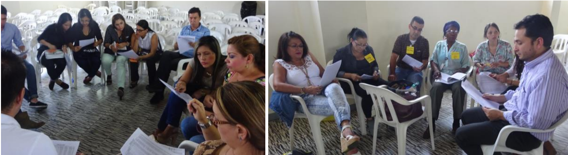
Fotos: Concurso Visualización Presupuesto Municipal. Equipo de gobierno Municipio de Bello – Antioquia, Mayo 7/15.

A partir de la explicación dada con respecto a la estructura del presupuesto municipal y los recursos del S.G.P, se propone a través de un juego entender las apropiaciones para cada sector. Cada equipo conformado se hace responsable de acuerdo con las ejecuciones de ingresos y gastos, escribir y leer correctamente la cifra solicitada. Así mismo, ubicarla dentro de la estructura en el lugar que corresponda.