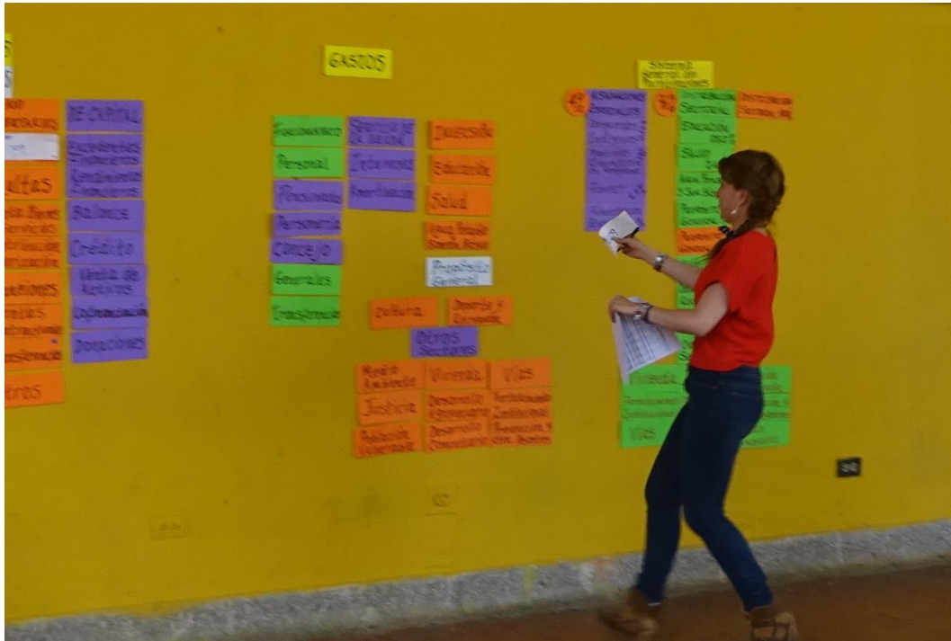
Fotos: Concurso Visualización Presupuesto Municipal. Equipo de la Comunidad Municipio de Bello – Antioquia, Mayo 8/15.