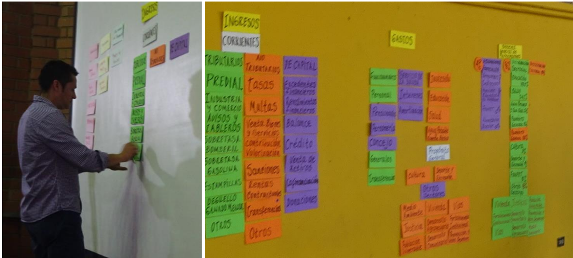
Fotos: Estructura de ingresos, gastos y el S.G.P. Equipo de la Comunidad. Municipio de Bello – Antioquia, Mayo 8/15.